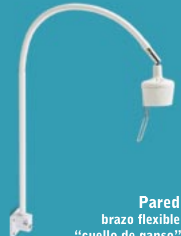
Pared brazo flexible “cuello de ganso”